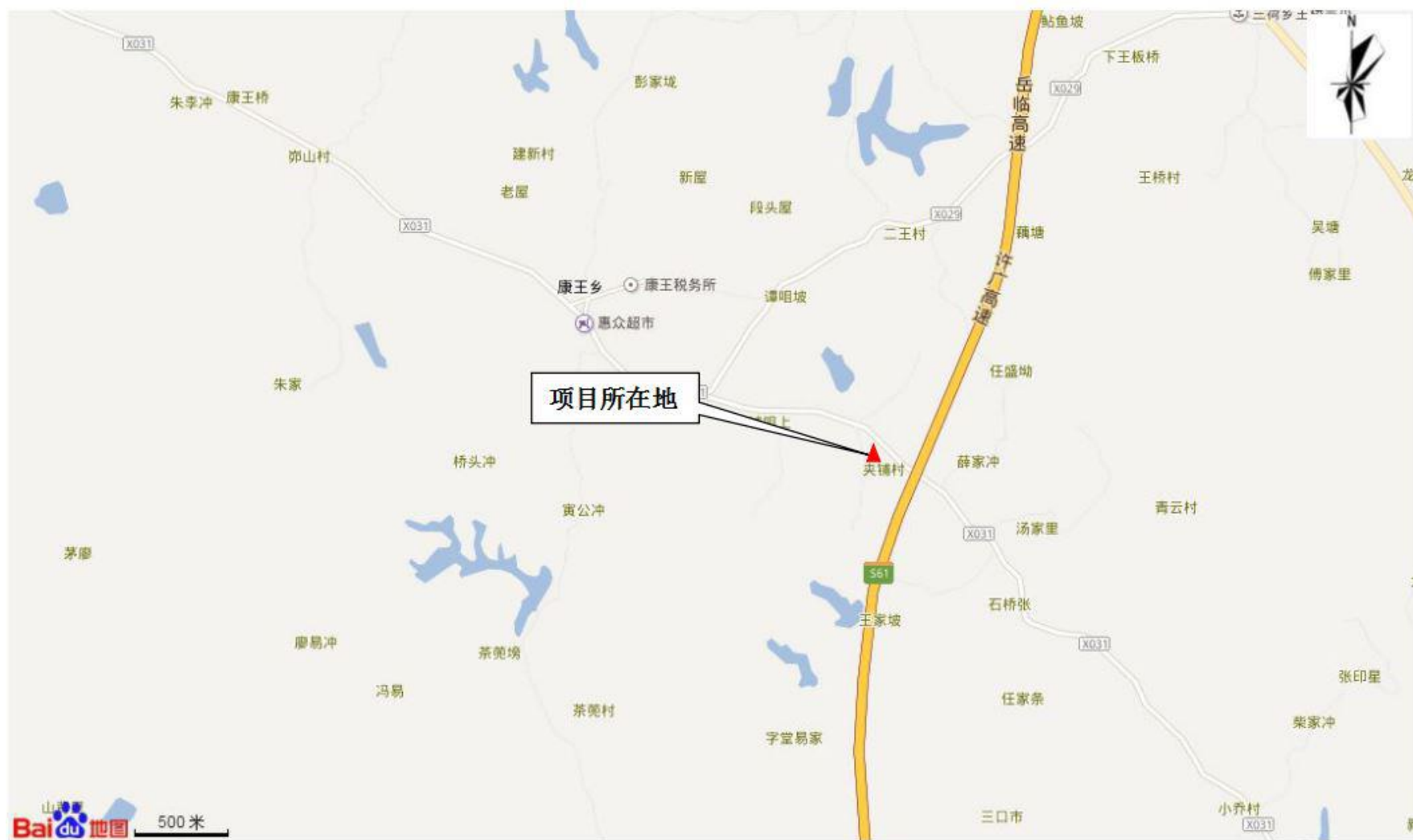
附图 1 项目地理位置图