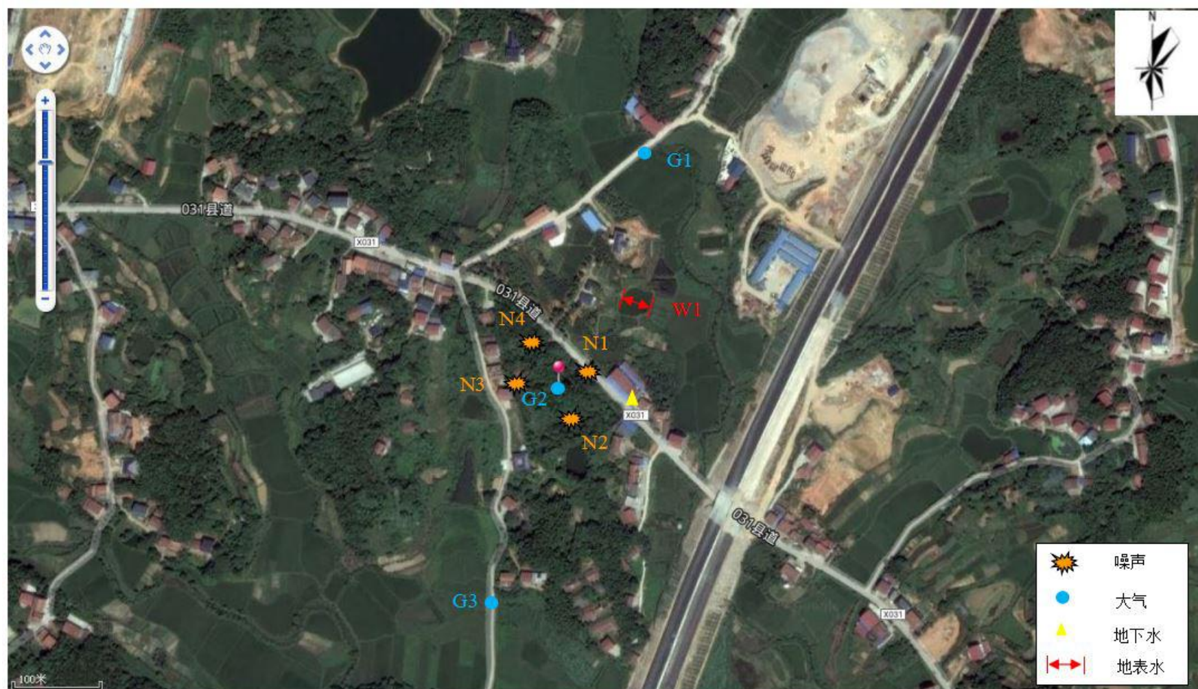
附图 4 环境现状监测布点图